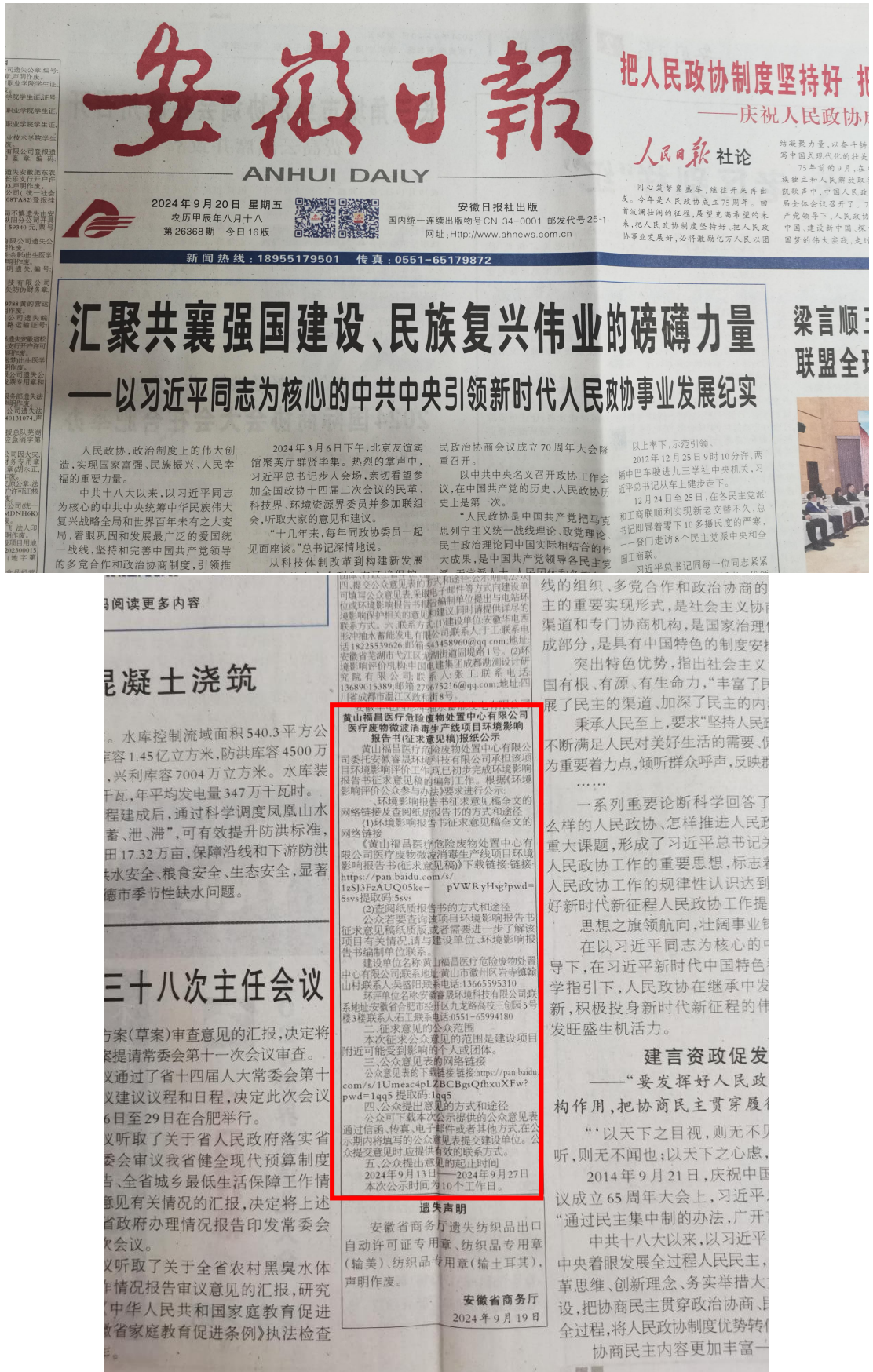
图 3-3 第二次报纸公示截图